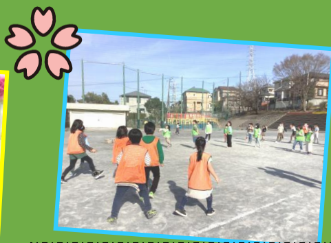
お別れ会ドッジボール大会