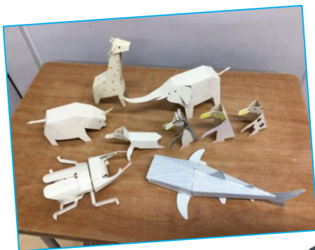
ペーパークラフト