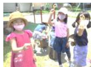
↑公園でシャボン玉