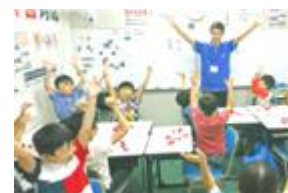
↑併設学習塾の様子