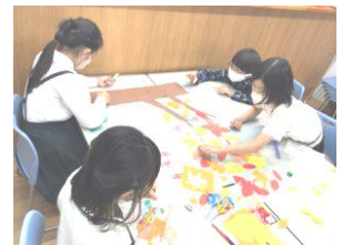
↑制作活動のようす