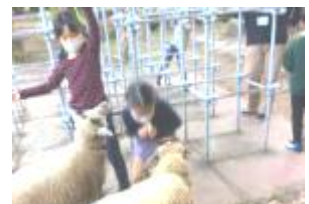
↑ 森での活動の様子