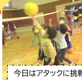
今日はアタックに挑戦!!