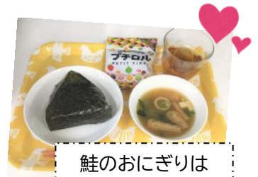
鮭のおにぎりは 人気のおやつ