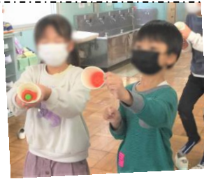
紙コップ鉄砲 誰が遠くまで飛ばせたかな