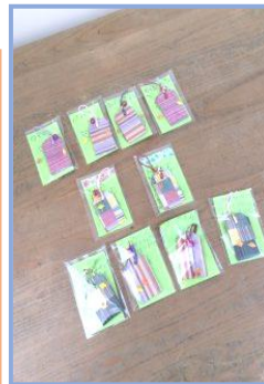
毎月たくさんの季節感あふれるプログラムをご用意しております!