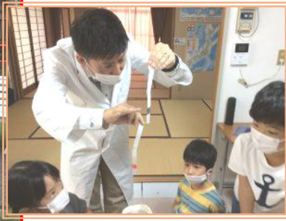
理科実験の様子。真剣なまなざし