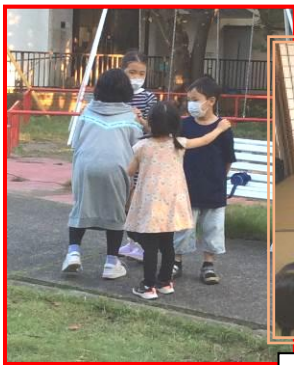
いつも仲良しなフエンテのお友だち

読書の秋、スポーツの秋、何をするにも快適な季節になりました。 現学年も後半となり新学期に向けての準備など、落ち着いて集中できる良い季節ではないでしょうか。 新しいフエンテでしっかりお勉強をして、お友だちと遊んで、秋の景色へと変わったお外で遊んで、ぜひ、 11月もフエンテをご活用ください。お待ちしております。