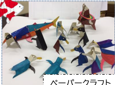
ペーパークラフト