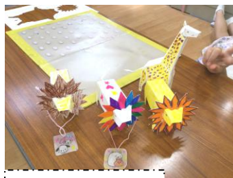
ペーパークラフト