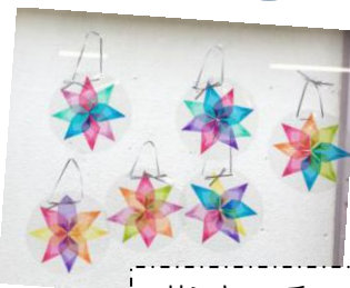
サンキャッチャー