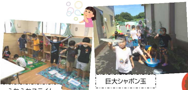
ふわふわスライム