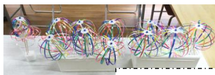
クルクルレインボー