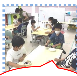
100万年前の 化石を発見しました♪