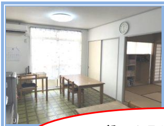
新フエンテの室内を紹介♪ 広々とした和室が広がっています。

秋も深まってきました。ゲームや外遊びなどフエンテでも楽しいことがいっぱい! スタッフが様々なプログラムを用意していますし、晴れていれば森や校庭で遊ぶこともできます。 新しいフエンテでいろいろなことを経験して、実りの多い秋を一緒に過ごしましょう!