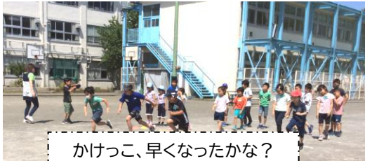
かけっこ、早くなったかな？