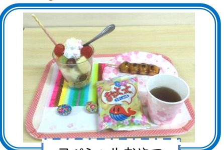
スペシャルおやつ