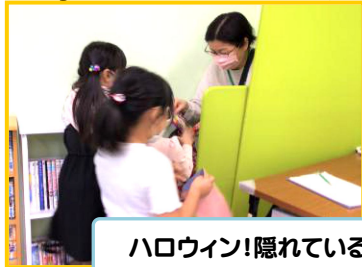
ハロウィン!隠れている先生からおやつをゲット!