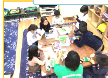
毛糸で作る小物入れ