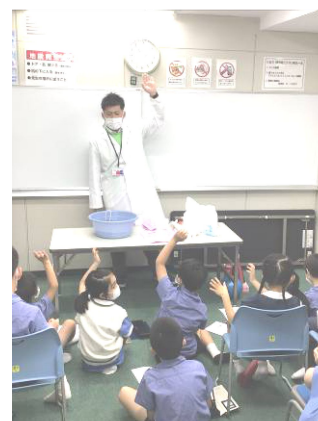
↑わくわく実験教室の様子。9月は「いろいろな形のシャボン玉をつくろう」でした。