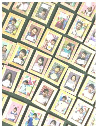
↑敬老の日プログラムでフォトフレームを作りました。おじい様おばあ様へ気持ちを含めたメッセージも添えて。

一気に感染者も減り、感染防止策を怠らず、通常に近い活動ができています。10~11月は入学選考の季節。次の1年生の合格が決まる時期です。現学年も後半を迎え、児童の成長を感じる日々ですが、児童にとっても実りの秋となるよう充実した放課後をご提供していきます。ぜひ、11月もアフタースクールをご活用ください。お待ちしております。