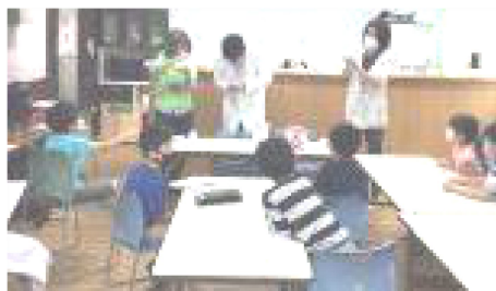
↑大好評「わくわく実験教室」 牛乳が1分間でアイスに大変身♪

季節もだんだんと夏らしい陽気になってきました。アフタースクールでは季節に合わせた様々なプログラムを用意しています。夏休みはフエンテのお友達とも一緒に過ごしますので、楽しい思い出をたくさん作りましょう!