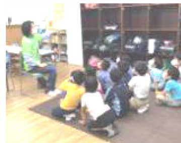
↑季節に合わせた絵本読み聞かせ。 とても真剣に物語を聞いています。