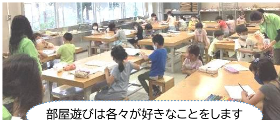
部屋遊びは各々が好きなことをします