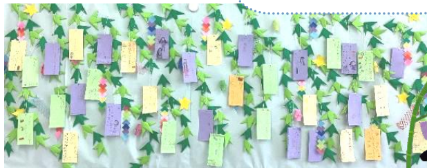
七夕に願いを込めて...