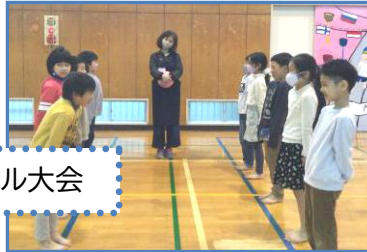
ドッジボール大会