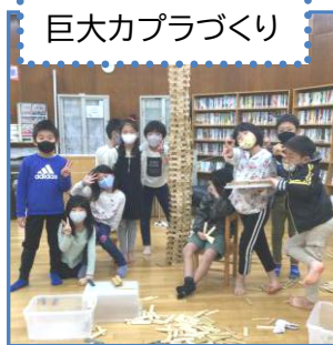
巨大カプラづくり