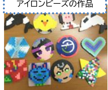
アイロンビーズの作品