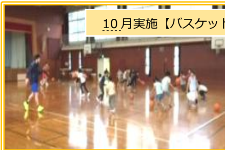
10 月実施【バスケットボールを体験しよう】

1 日あたりの利用人数も、プログラム実施日はとても多く、子どもたちがプログラムを楽しみにしていることがよくわかります。今度も子どもたちの楽しみに、ご協力をお願いいたします。