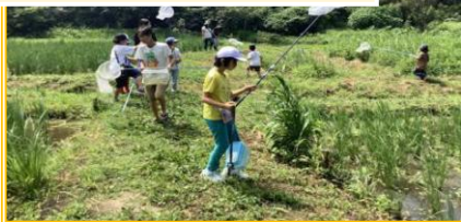
8 月実施【てらこやさんと広町散策】

1 日あたりの利用人数も、プログラム実施日はとても多く、子どもたちがプログラムを楽しみにしていることがよくわかります。今度も子どもたちの楽しみに、ご協力をお願いいたします。