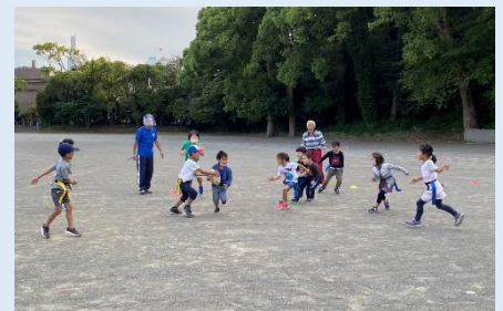
おなり タグラグビー教室