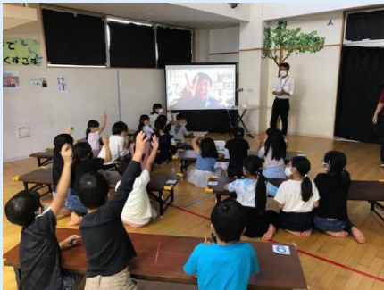
だいいち 宇宙教室(オンライン)