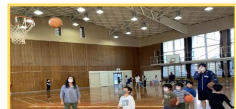
10 月実施【バスケットボールを体験しよう！】