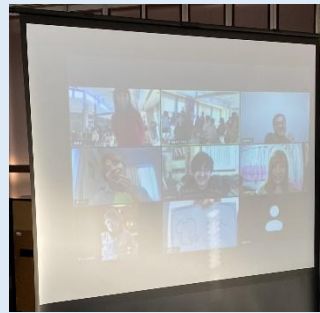
にかいどう てらこやさんと遊ぼう