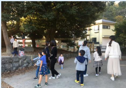
にかいどう 鎌女学生とすごろくコマ撮影