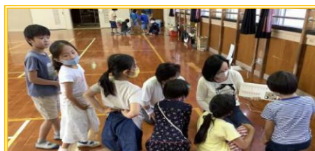
9 月実施【マイコンで動くおもちゃのおはなし】