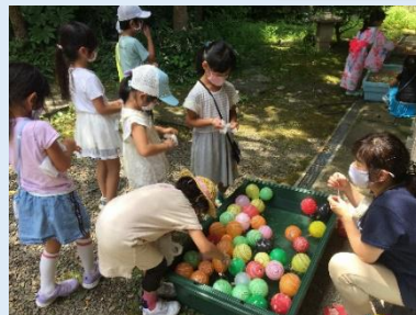
おさか 子ども縁日