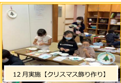
12月実施【クリスマス飾り作り】