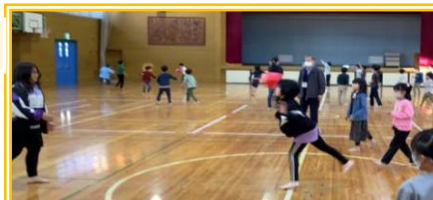
11月実施【みんなとドッジボールで遊ぼう】