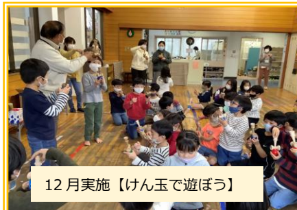
12月実施【けん玉で遊ぼう】