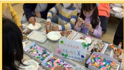
11月実施【おしゃれな鳥飾りを作ろう】