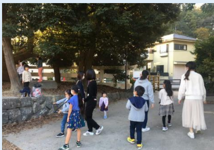
にかいどう 鎌女学生とすごろくコマ撮影