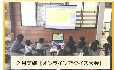
2月実施【オンラインでクイズ大会】