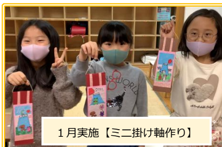
1月実施【ミニ掛け軸作り】