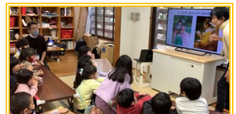
11月実施【出張！おしゃべり美術館】