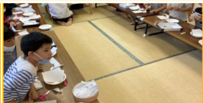
10月実施【アロータと切り絵チャレンジ！】

1日あたりの利用人数もプログラム実施日はとても多く、子どもたちがプログラムを楽しみにしていることがよくわかります。今度も子どもたちの楽しみに、ご協力をお願いいたします。