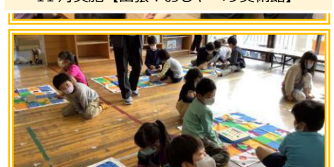
12月実施【プログラミングチャレンジ】