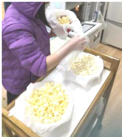
感染症対策で配膳の際は 手袋・マスクを着用しています

12月と言えばクリスマス。お部屋も手作りのクリスマスの飾りつけをたくさん飾り、16日にクリスマスパーティを開催。おやつを食べながらスタッフのピアノ演奏と踊りを楽しみ、その後はみんなでビンゴを楽しみました！貰ってからみんなで景品を見せ合い、お互いに欲しいものを相談して交換していました。おうちで景品を使っているかな？