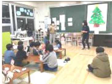
お手製「ツリー」の前で ビンゴ大会♪