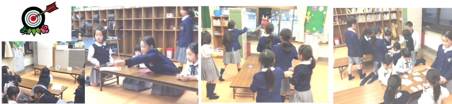
↑上級生が企画してくれたプログラム「射的大会!」 ↑「鬼は外」みんなで豆まき! ↑ブームのトランプの「スピード」↑ 当たったら、折り紙で作った素敵的なものがもらえました。 一足早い節分でした。 トーナメント戦で白熱!

インフルエンザや胃腸炎が心配される季節ですが、アフタースクールのみんなは寒暖差にも負けず、元気に活動しています。教室で過ごす時間が増えたので、カードゲームで白熱する時間が増え、腕前も驚くほど上達しました! 少しずつ日が長くなり、大好きな外遊びの時間ものびてきました。校庭の梅の花も咲き始め、春が待ち遠しいです。