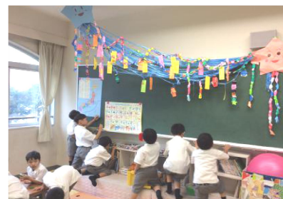
↓ 《通常の活動の様子》 ↑

新学期が始まったかと思うと、あっという間に夏休みです。 この約3カ月で、友達と慣れあい、素の自分を出して自然体で小野の子で過ごすようになりました。その中で、意見の違いでぶつかり合ったり、自分の言い分を訴えてきたりなどいろいろなことがあります。 でも 小野の子では、まず、お互いで話し合いどう解決したら良いかを考えてもらい、周りで見ている友達も解決へと一緒になって考えます。 同じ繰り返しの日ですが、夏休みという長い時間を一緒に過ごすことで、思いやりや団結力が育まれていく場となっていくことでしょう。児童たちのさらなる成長が楽しみです。