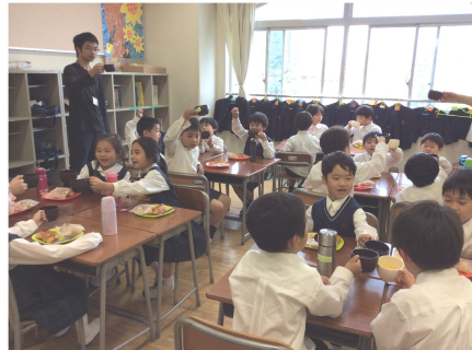
*おやつタイム 勉強を終えると、楽しくおやつをいただきます。 (課外が始まると、時間差になることもあります。)