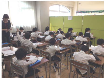
*学習タイム 宿題や持込学習道具に集中して取り組みます。