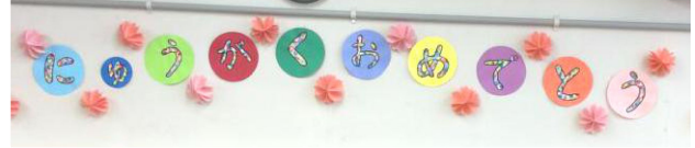
教室の壁面には、手作りで「にゅうがくおめでとう」の掲示。

お子さんのご入学・ご進級、おめでとうございます。4月になり約1ヶ月、お子さんも新学年に少しずつ慣れてこられたでしょうか?キッズクラブでも4月の出会いに向け、様々な取り組みを行いました。今月はキッズルームの様子を写真とコメントで紹介します。またこれから1年間、どうぞよろしくお願いいたします。