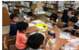
8月22日(火) 理科実験教室