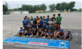
8月23日(水) 横浜FCサッカー教室