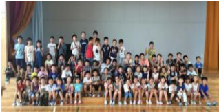
8月1日(火) 中山小キッズ交流会

今年の夏休みはたくさんのイベントを行いました。お子さんたちの楽しそうな様子を写真でご覧ください。