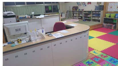
新しくなったキッズルーム。自慢の受付はまるでホテルのフロントさながら!?

3月からキッズクラブへ転換するにあたりキッズルームをリフォームしました。キレイで新しく、活動を行うのに最適な空間となりました。今後お子さんと楽しく充実した活動ができる環境になり、スタッフも気合十分です。