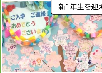
新1年生を迎える壁飾り