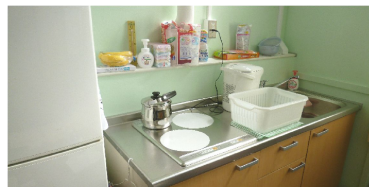
17時以降も在室するお子さんにはおやつを提供します。キッチンも新設し、素敵なおやつを計画♪