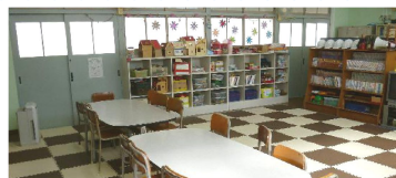
新しくなったキッズルーム。明るい部屋に子どもたちの楽しそうな声が響きます。

3月からキッズクラブへ転換するのにあたりキッズルームをリフォームしました。きれいで新しく、活動を行うのに最適な空間となりました。今後お子さんと楽しく充実した活動ができる環境になり、スタッフも気合十分です。